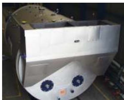
Экономайзер смонтированный на котле для неограниченного индивидуального использования горелок.

Даже расчеты эксплуатационных затрат показывают, что котлы большей мощности с двумя жаровыми трубами должны всегда укомплектовываться экономайзерами, в идеале смонтированными сверху на котле в задней его части. Котлы с двумя жаровыми трубами, которые подчас работают только с одной горелкой, должны иметь отдельные каналы продуктов сгорания в экономайзере. Свободный выход продуктов сгорания с давлением не более 0 мбар за экономайзером является нормой, но следует принимать во внимание возможное дополнительное сопротивление при установке шумоглушителей на выхлопе. Здесь, в отдельных случаях, необходимо определить сопротивление дополнитель-